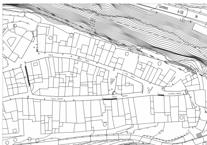
Disposición de mesas y sillas en las calles del Casco Histórico